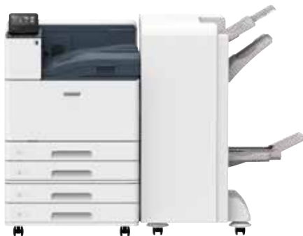
額外紙盤模組 (2 段) 和 C3 騎馬裝訂檢集機