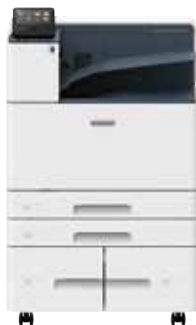
額外並排紙盤模組 紙張容量高達 3075 張