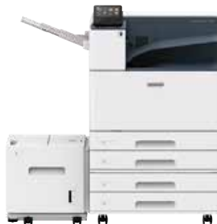
額外紙盤模組 (2 段) 和 大容量紙盤 (一段) 和側承接盤 紙張容量高達 4120 張