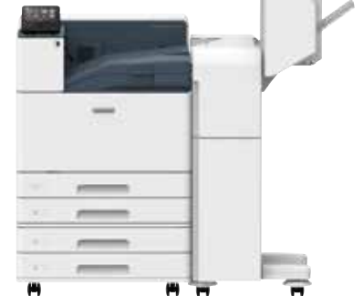
額外紙盤模組 (2 段) 和 B3 裝訂檢集機和小冊子裝訂組件 50 張裝訂容量 / 打孔 / 騎馬訂 / 單摺