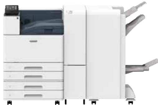
額外紙盤模組 (2 段) 和 C3 騎馬裝訂檢集機和摺紙模組 CD1

裝訂容量高達 50 或 65 張 / 打孔 / 騎馬訂 / 單摺 / 三摺頁 / 工程 Z 型摺頁