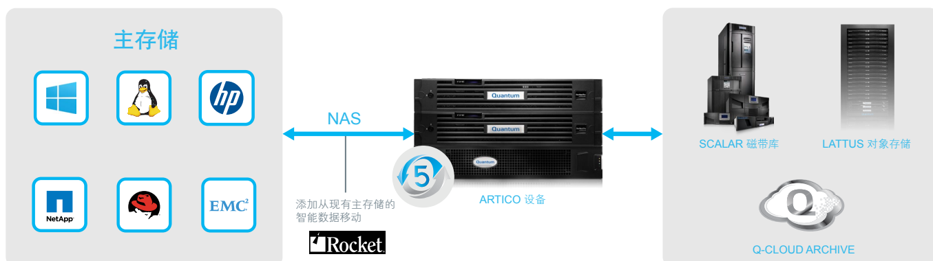
图 1 - Artico 能够与 Rocket Arkivio Autostor 智能数据管理软件或者您所选择的软件相结合，将数据由主存储迁移至更加经济高效的归档层

昆腾的业务遍及全球 180 多个国家/地区，可针对我们广泛的产品线（包括 Artico、StorNext、Scalar®、Lattus™ 和 Q-Cloud™ Archive）提供全天候的在线和多语种专家电话支持。